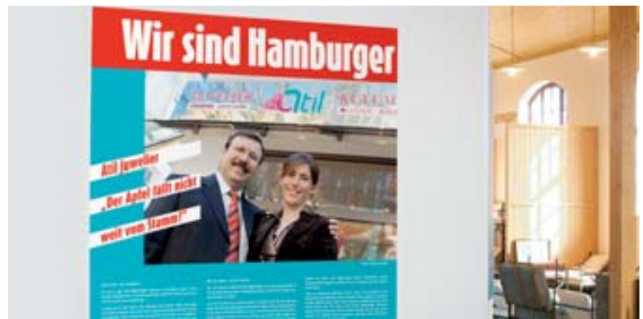
„Wir sind Hamburger“ im Museum Auswandererwelt Ballinstadt

Wir präsentierten und präsentieren die Ausstellung dort, wo sie Einheimischen und Migranten zugänglich ist und dazu einlädt, Menschen aus einem anderen als dem alltäglichen Blickwinkel wahrzunehmen.